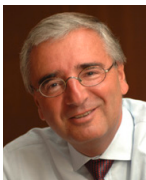
DR. OEC. HSG. PAUL ACHLEITNER